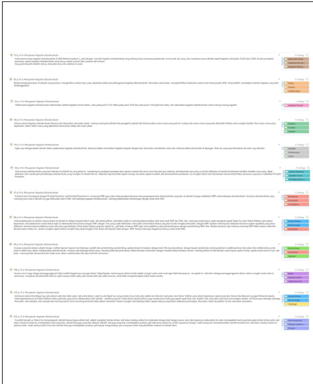
Gambar 1. Manajemen Ekstrakurikuler di SMA Muhammadiyah 2 Al-Mujahidin Balikpapan