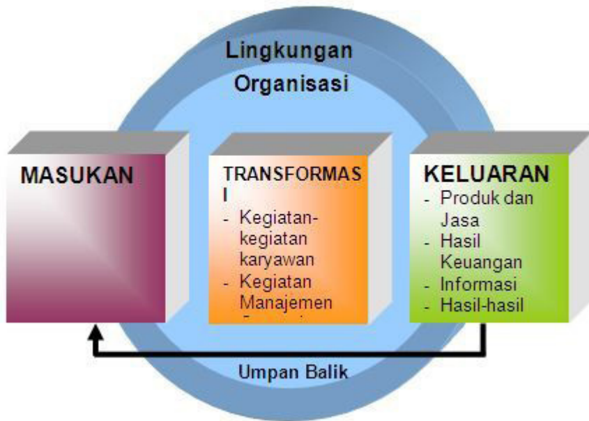
Gambar Organisasi Sebagai Sistem Terbuka

Apabila suatu organisasi dipandang sebagai suatu sistem terbuka, konsep tersebut merujuk pada kemampuan organisasi bisnis untuk menerima input yang mencakup berbagai elemen seperti bahan mentah, sumber daya manusia, modal, teknologi, dan informasi. Proses transformasi kemudian berperan dalam mengubah berbagai masukan ini menjadi produk jadi atau jasa melalui serangkaian kegiatan kerja yang dilaksanakan oleh karyawan. Dalam konteks ini, kegiatan manajemen dan metode operasi menjadi unsur krusial yang berkontribusi pada proses transformasi tersebut (Harto, Budi, dkk, 2021: 91).