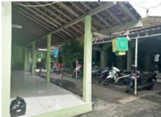
Gambar 5. Kampus 3