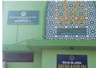
Gambar 6. Kampus 4