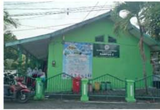
Gambar 2. Kampus 2