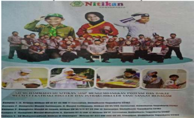
Gambar 9. Foto Majlis Guru beserta bentuk kegiatan ekstrakurikuler

Mempermudah pemahaman akan lokasi Sekolah Dasar (SD) Muhammadiyah Nitikan Yogyakarta dapat dilihat pada tabel berikut: