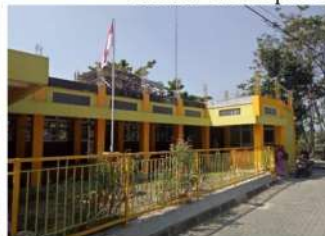
Gambar 8. Kampus 5