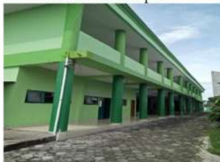
Gambar 7. Kampus 4