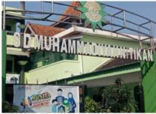
Gambar 1. Kampus 1