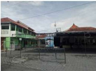
Gambar 3. Kampus 2