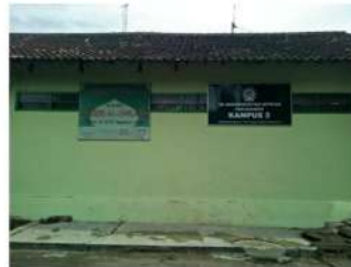
Gambar 4. Kampus 3