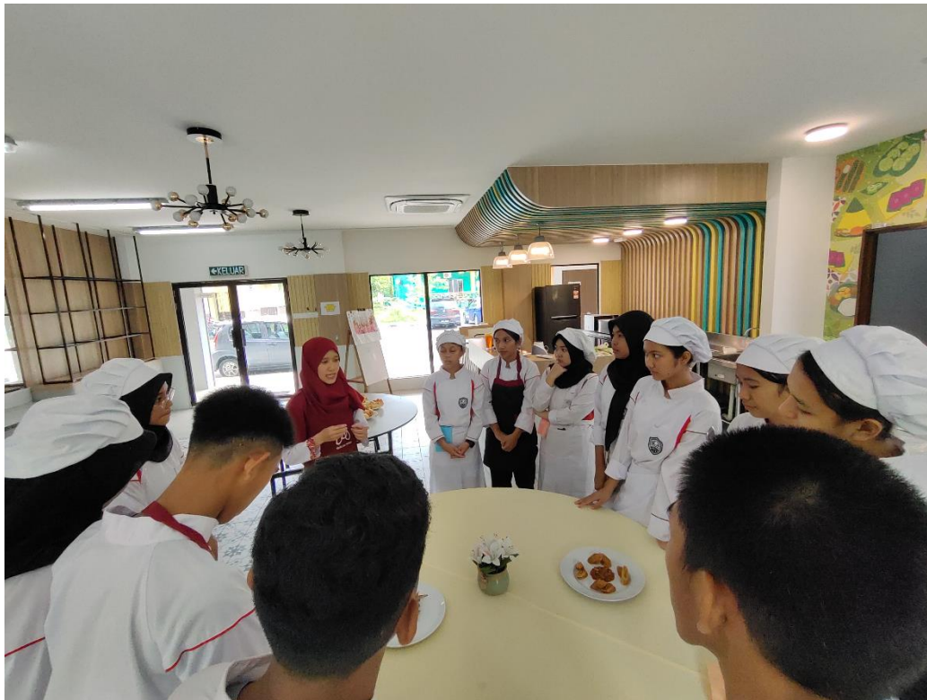
Tabel Keberdayaan Mitra Kegiatan PkM