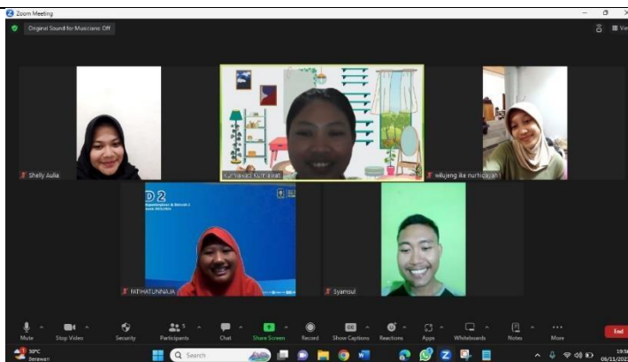
Sharing session bersama DPL