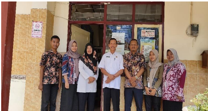
Monitoring Evaluasi (Monev) oleh tim BPMP bersama Kepala sekolah dan guru pamong.