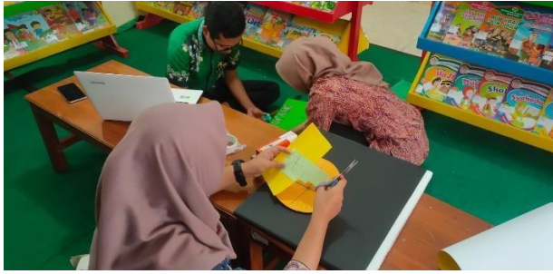
Pembuatan Media Pembelajaran