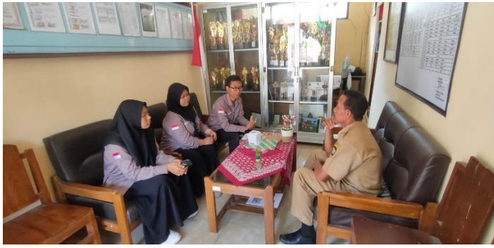
Diskusi terkait program kerja bersama kepala sekolah