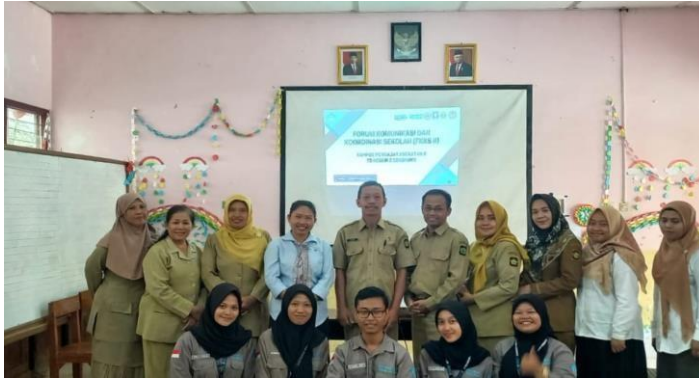
Forum komunikasi dan koordinasi sekolah (FKKS)