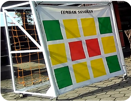
Alat Tembak Sasaran Tampak Depan