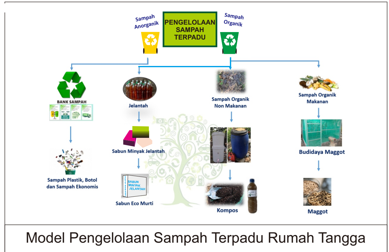
Model Pengelolaan Sampah Terpadu Rumah Tangga