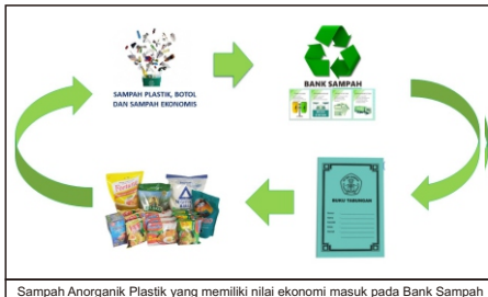
Sampah Anorganik Plastik yang memiliki nilai ekonomi masuk pada Bank Sampah