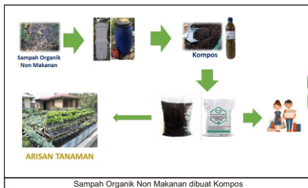
Sampah Organik Non Makanan dibuat Kompos