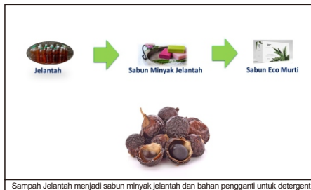
Sampah Jelantah menjadi sabun minyak jelantah dan bahan pengganti untuk detergent