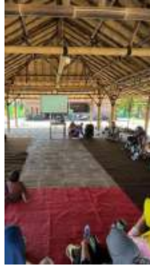
Memeriahkan Kegiatan Pesona Nada