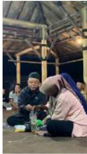
Menyelenggarakan Pelaksanaan Kegiatan Olahraga Tradisional