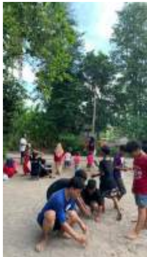
Mengenalkan Permainan Tradisional bagi Anak-Anak Dukuh Kadisoro