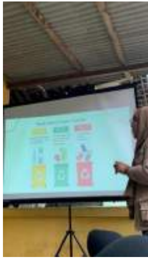
Edukasi Pemilihan Sampah di SD Muhammadiyah Kadisoro 1