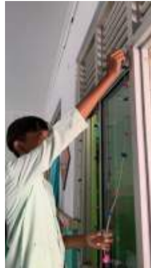
Kerja Bakti Desa Wisata Dewi Kaji