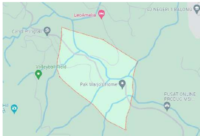
Gambar 1.1 Wilayah Geografi Padukuhan Pringtali

Pringtali merupakan salah satu Dusun di Desa Kebonharjo, Kecamatan Samigaluh, Kulon Progo, Daerah Istimewa Yogyakarta, Indonesia. Dilansir dari pranala resmi dari kalurahan Kebonharjo, desa ini memiliki luas \pm 73,48 Hektar yang terdiri dari 1 RW dan 2 RT, yaitu RW 06, RT 15 dan RT 16. Jumlah penduduk Dusun Pringtali pada tahun 2019 sebanyak 219 jiwa yang terdiri dari 72 kartu keluarga.