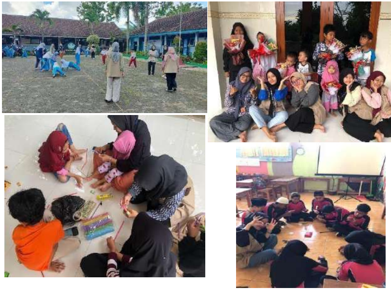
gambar 4 16 Kegiatan seni dan olahraga