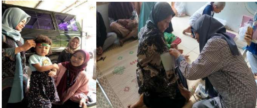
gambar 4 18 pendampingan posyandu balita dan lansia

Kegiatan ini terbagi menjadi pendampingan posyandu balita dan posyandu lansia yang keduanya diadakan pada hari yang sama yaitu 11 Februari 2024. Adapun pendampingan posyandu balita bertujuan untuk membantu kader posyandu dalam melakukan pelayanan kesehatan dasar, seperti penimbangan balita, pemberian imunisasi, penyuluhan gizi serta turut memastikan pelaksanaan posyandu berjalan dengan baik sesuai standar dan prosedur yang ditetapkan. Sementara itu, pendampingan posyandu lansia bertujuan untuk membantu kader dan petugas kesehatan melakukan pelayanan kesehatan rutin bagi lansia, seperti pengukuran tekanan darah, gula darah, berat badan, serta memberikan penyuluhan dan konseling kepada lansia terkait pola hidup sehat dan pencegahan penyakit degeneratif. Adapun kendala yang dihadapi ketika pelaksanaan posyandu balita ialah terdapat balita yang menangis ketika akan dilakukan penimbangan, sedangkan pelaksanaan posyandu lansia berjalan dengan baik tanpa adanya kendala apapun.