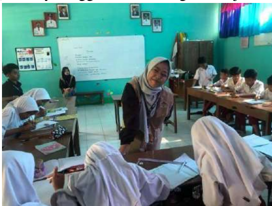
gambar 4 13 Penyelenggaraan Bimbingan belajar di SD N Sulur