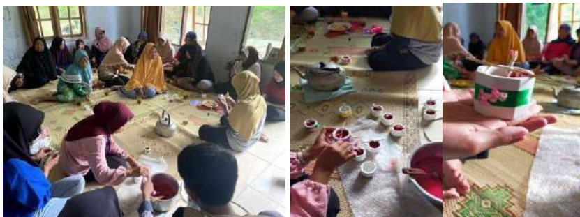
gambar 4 20 pelatihan dan pengelolaan minyak jelantah menjadi lilin Bersama Ibu-Ibu PKK

Pembuatan lilin dari minyak jelantah dilaksanakan pada hari minggu tanggal 11 Februari 2024 bersama ibu-ibu PKK Dusun Tukmudal. Tujuan kegiatan ini ialah memanfaatkan limbah minyak jelantah agar menjadi barang yang bisa digunakan kembali, contohnya lilin. Umumnya masyarakat cukup antusias terhadap pembuatan lilin dari minyak jelantah karena mengurangi limbah dan memberikan nilai tambah pada minyak bekas yang biasanya dibuang. Selain itu, kesadaran akan pentingnya daur ulang juga semakin meningkat, menjadikan pembuatan lilin dari minyak jelantah sebagai pilihan yang ramah lingkungan.