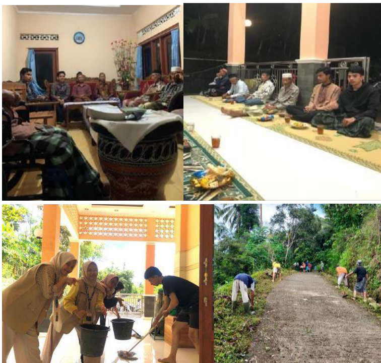
gambar 4 23 penyelenggaraan kegiatan masyarakat

Tujuan penyelenggaraan kegiatan masyarakat ialah membangun solidaritas, interaksi, dan kerja sama antar anggota masyarakat. Kegiatan masyarakat dapat mempererat hubungan sosial. Kegiatan kemasyarakatan ini terbagi menjadi 3 yaitu mendampingi kegiatan bersih-bersih pedukuhan yang pelaksanaannya dilakukan pada tanggal 4, 11, 24 Februari 2024, selanjutnya mengadakan kegiatan bersih-bersih rutin masjid dilaksanakn tanggal 1,8,15 Februari 2024, serta mengikuti pengajian rutin pedukuhan Tukmudal yang pelaksanaannya dilakukan tanggal 5, 12, 19, 26 Februari 2024.