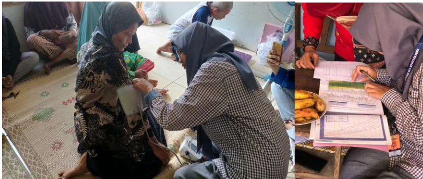
gambar 4 14 Penyelenggaraan Kegiatan Sosialisasi dan Edukasi Kesehatan di Tukmudal