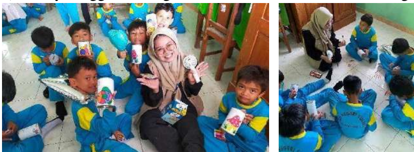
gambar 4 1 kegiatan sosialisasi dan edukasi keuangan