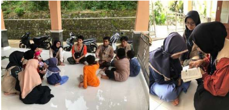
gambar 4 15 Penyelenggaraan TPA di Tukmudal

membimbing perbaikan bacaan sholat ruku' kepada anak-anak, mengedukasi nama-nama sahabat nabi kepada anak TPA, mengenalkan makhrajul huruf kepada anak-anak, mengenalkan nama-nama neraka, mengedukasi gerakan-gerakan sholat melalui video, mendampingi tadarus Al-quran, dan mengajarkan tentang hadist-hadist nabi. Tidak ada kendala yang dihadapi karena anak-anak sangat antusias untuk belajar hal-hal baru.