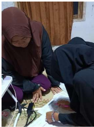
gambar 4 3 Bimbingan Belajar Matematika Dasar