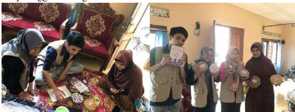
gambar 4 2 Sosialisasi dan Edukasi Kewirausahaan