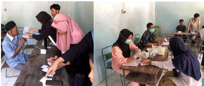
gambar 4 17 sosialisasi dan edukasi Kesehatan

Tujuan dari kegiatan ini yaitu memberikan edukasi dan penyuluhan kepada masyarakat mengenai berbagai topik kesehatan di antaranya gizi seimbang dan pencegahan stunting yang diadakan pada tanggal 11 Februari 2024. Selain itu diadakan juga pendampingan kegiatan skrining dan cek kesehatan warga Tukmudal pada tanggal 22 Februari 2024. Adanya sosialisasi dan edukasi kesehatan ini diharapkan dapat mendorong masyarakat untuk menerapkan perilaku hidup bersih dan ehat dalam keseharian mereka serta membangun kesadaran pentingnya menjaga dan memelihara kesehatan sejak usia dini. Penyelenggaraan sosialisasi dan edukasi kesehatan ini berjalan dengan baik tanpa adanya kendala