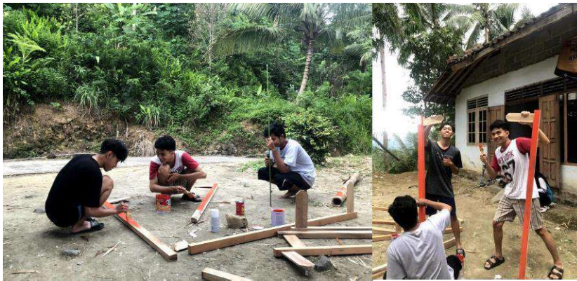
gambar 4 22 pembuatan plang rt/rw padukuhan Tukmudal

Tujuan kegiatan ini memberikan identitas dan pengenalan formal bagi pedukuhan. Dengan adanya plang nama, setiap orang yang melintas atau memasuki wilayah pedukuhan tersebut dapat mengetahui letak lokasi dukuh, rt, rw, lkmd, dan masjid. Dengan plangisasi yang jelas, lokasi dan batas-batas wilayah menjadi lebih jelas sehingga mempermudah penyelenggaraan pemerintahan. Adapun kegiatan ini dimulai dengan melakukan survei tempat titik lokasi untuk penempatan plang pada tanggal 9, 15 Februari 2024. Selanjutnya dilakukan pembuatan plang dan pengecatan plang petunjuk arah pada 16, 17 Februari 2024. Adapun pemasangan plang petunjuk arah pedukuhan Tukmudal dilaksanakan pada 25 Februari 2024.