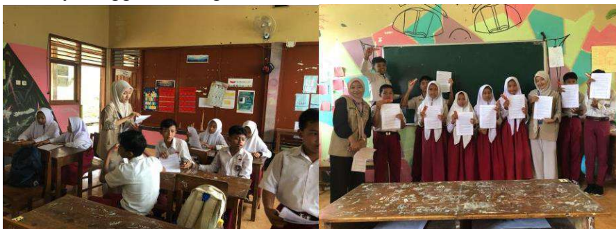
gambar 4 9 Penyelenggaraan Kegiatan Sosialisasi dan Edukasi Literasi di SDN Sidoharjo