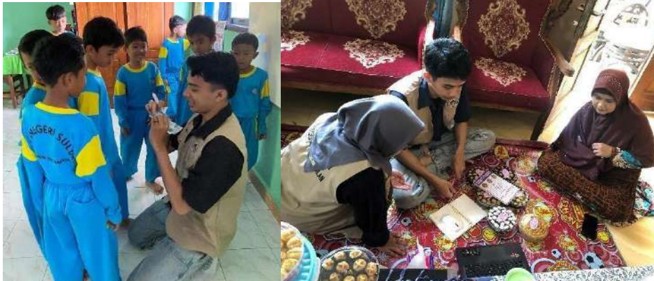
gambar 4 4 Sosialisasi dan Edukasi Keuangan