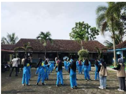
gambar 4 24 penyelenggaraan kegiatan olahraga di SDN Sular

Tujuan kegiatan ini ialah memberikan kegiatan yang menyenangkan dan menghibur bagi siswa sebagai selingan di tengah rutinitas belajar. Selain itu, tujuan lain kegiatan ini yaitu meningkatkan kebugaran jasmani dan kesehatan siswa. Para siswa diperkenalkan berbagai jenis olahraga dan manfaatnya sejak dini sebagai investasi gaya hidup sehat di masa depan. Senam dan jalan sehat bermanfaat bagi kesehatan dan kebugaran tubuh siswa. Adapun pelaksanaan kegiatan ini dilakukan pada 23 Februari 2024.