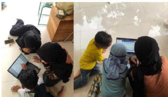
gambar 4 8 Penyelenggaraan Bimbingan Belajar kepada anak-anak Tukmudal