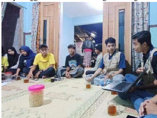
gambar 4 6 Penyelenggaraan Edukasi tentang keamanan akun kepada pemuda