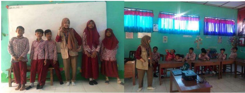
gambar 4 7 Penyelenggaraan Edukasi Tentang Teknologi di SDN Sulus