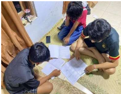
gambar 4 5 Penyelenggaraan Bimbingan Belajar