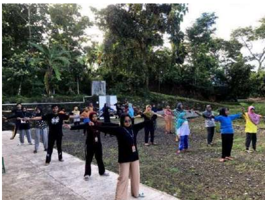
gambar 4 25 penyelenggaraan senam Bersama warga Tukmudal

Penyelenggaraan Tukmudal sehat dengan kegiatan senam yang menargetkan lansia sebagai sasaran utama dilaksanakan pada 18, 22, dan 25 Februari 2024. Kegiatan ini bertujuan untuk menjaga dan meningkatkan kebugaran dan kesehatan fisik lansia. Senam dapat menjaga kelenturan tubuh dan mengurangi risiko penyakit pada lansia. Selain itu, kegiatan ini juga bertujuan untuk mempererat silaturahmi dan interaksi sosial antar lansia serta memotivasi lansia menerapkan pola hidup sehat dan aktif di keseharian mereka.