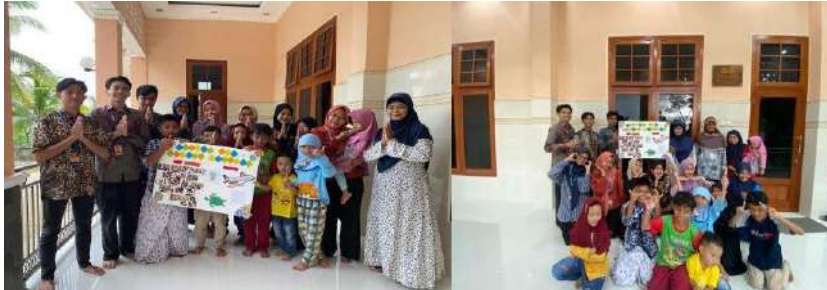
gambar 4 21 pembuatan madding TPA sekaligus penyerahan kepada TPA Tukmudal

Kemudian, peresmian madding sendiri dilakukan pada 26 Februari 2024. Kami berharap hal ini bisa bermanfaat bagi semua pihak dalam menjalin silaturahmi.