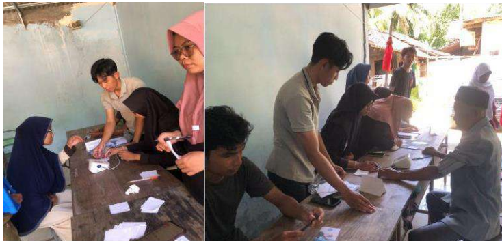
gambar 4 11 Penyelenggaraan Kegiatan Sosialisasi dan Edukasi Kesehatan di Tukmudal