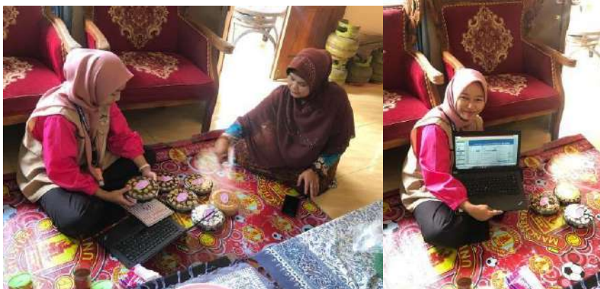
gambar 4 12 Penyelenggaraan Edukasi Pemasaran Melalui Media Sosial di Tukmudal

1) Penyelenggaraan Edukasi Pemasaran Melalui Media Sosial