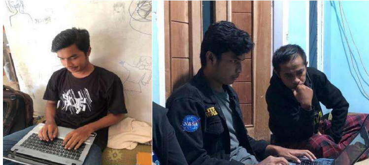
gambar 4 19 pembuatan identitas pedukuhan berupa website profil desa

kegiatan ini adalah ketika proses coding website terkadang terdapat error sehingga perlu mengulangi langkah sebelumnya.