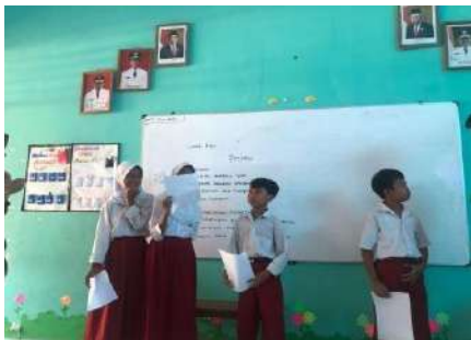
gambar 4 10 Penyelenggaraan Bimbingan Belajar di SD N Sulur