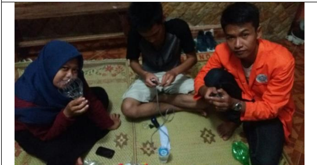
Pelatihan lampu hias