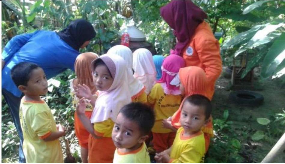
Sosialisai menjaga kesehatan diri