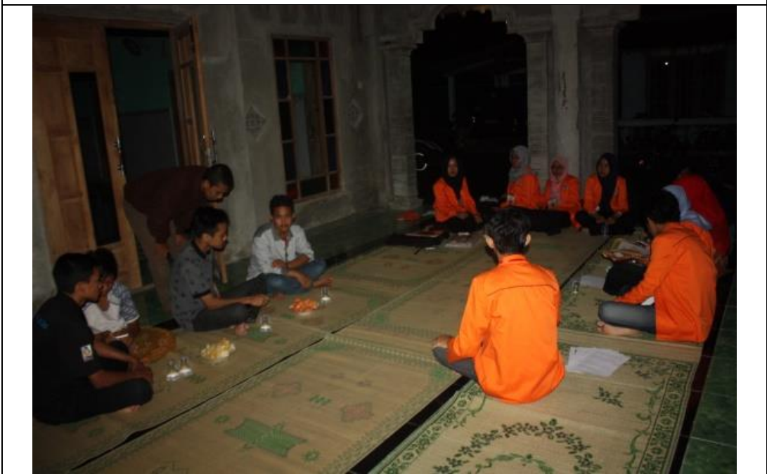
Pelatihan islamic public speaking