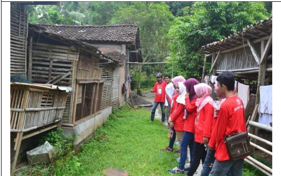
Pengadaan profil Desa