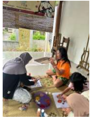
Seni kolase biji-bijian