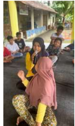
Festival sholeh Sambung ayat