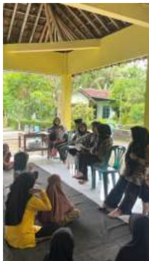
Festival sholeh tebak kata