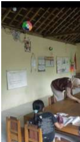
Bimbel Bahasa Indonesia