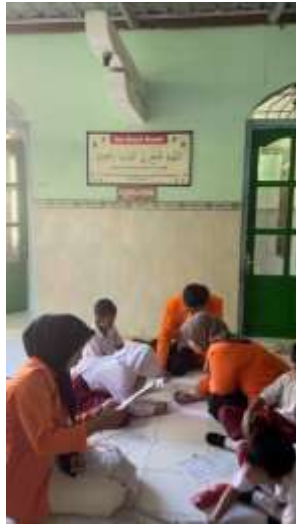
Mengajar di SD kelas 2