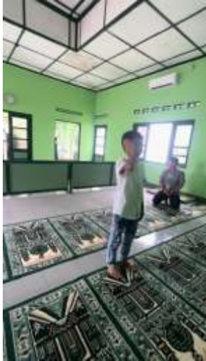
Festival sholeh adzan