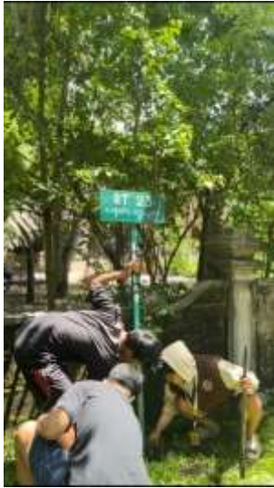
Pemasangan Plakat Jalan