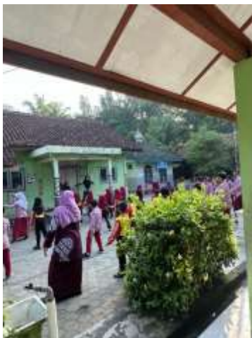
Senam Bersama anak Sd