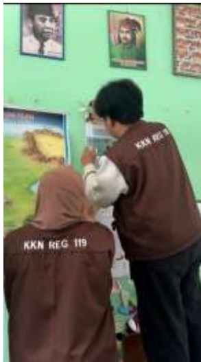
Pembuatan Poster M. diri