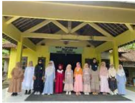
Festival sholeh fashionshow