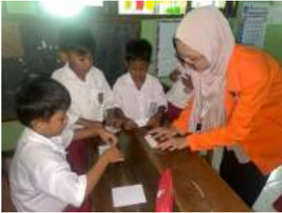
Edukasi Apoteker cilik