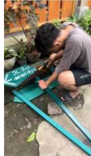
Pembuatan Plakat Jalan