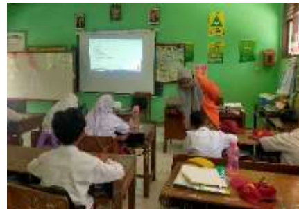
Mengajar B indo ke SD