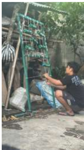
Pembuatan Lorong Sayur