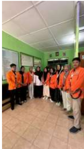
Survai ke SDN Proketen