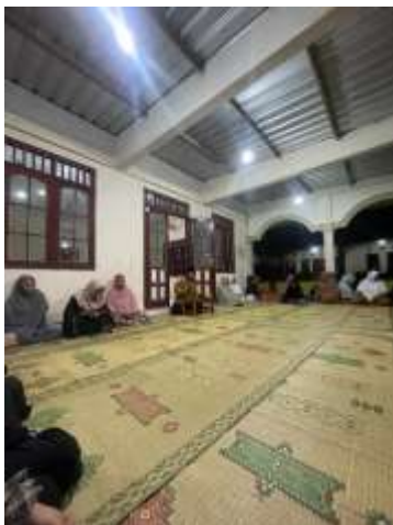
Pengajian rutin PKK