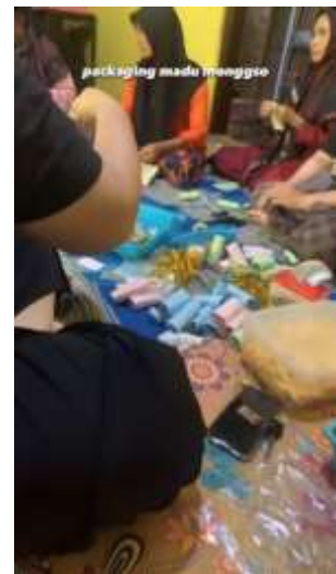
Membantu ibu PKK