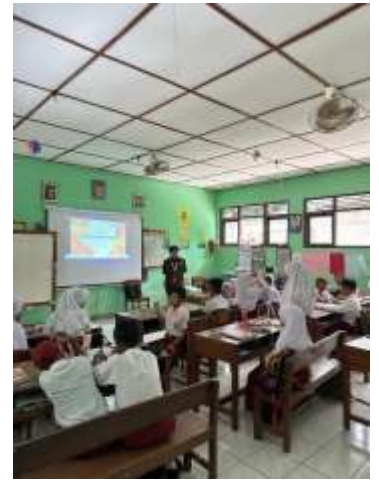
Sosialisasi M. Waktu