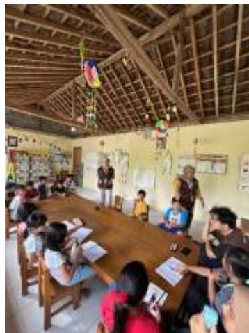
Pembuatan Seni Origami