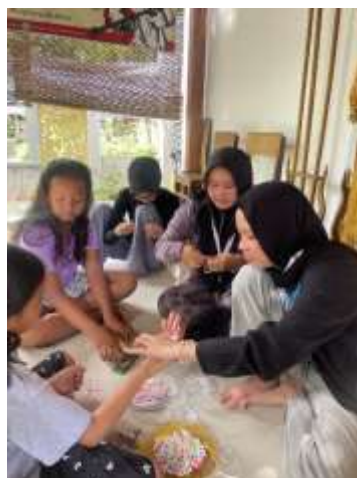
Proker seni manik manik