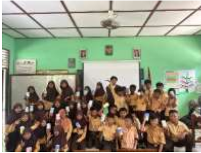
Sosialisasi M. Keuangan