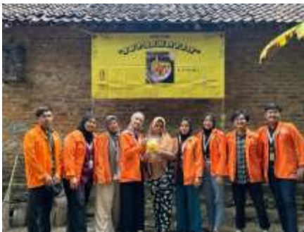
Penyerahan Branding Kripik