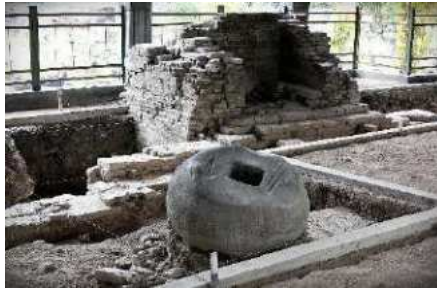
Gambar 1. Situs Peninggalan Kerajaan Mataram Islam yakni Masjid Kauman Pleret

Kuliah Kerja Nyata (KKN) Reguler periode 123 Universitas Ahmad Dahlan Divisi I.C.1 tahun akademik 2023/2024 yang berlokasi di Kalurahan Pleret, Kecamatan Pleret, Kabupaten Bantul, Provinsi Daerah Istimewa Yogyakarta. Adapun profil Kalurahan Pleret yang merupakan kawasan cagar budaya petilasan zaman Mataram Kerto yaitu Ibukota Mataram yang sebelumnya di Kotagede. Keraton ini didirikan oleh Sultan Agung. Peninggalan-peninggalan Keraton Kerta dapat dikatakan sangat minim. Peninggalan yang minim itu pun tidak begitu banyak membantu untuk memperkirakan bagaimanakah kira-kira bentuk Keraton Kerto pada zamannya. Potensi fisik yang dimiliki kawasan cagar budaya ini adalah Masjid, sisa-sisa bangunan kraton, tembok keliling, serta makam Ratu Malang di Gunung Kelir.