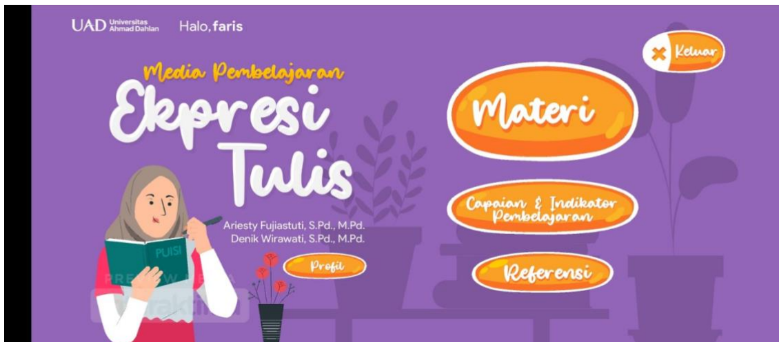
Halaman Home sistem

Halama homeberisikan ,nama mahasiswa yang sudah diinput dan pada halaman ini ditampilkan profil nama pengajar, Materi, Capaian Indikator Pembelajaran dan Referensi.