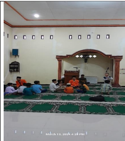
March 13, 2024 4:28 PM