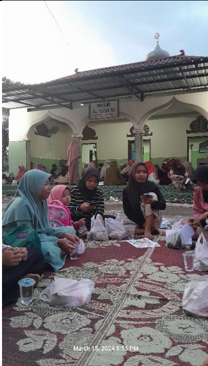
March 15, 2024 5:55 PM