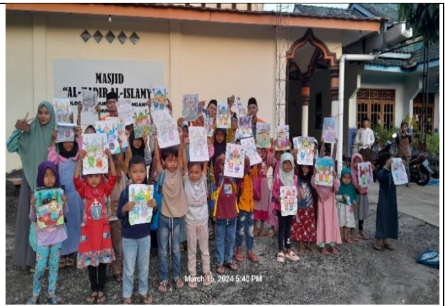
March 15, 2024 5:40 PM