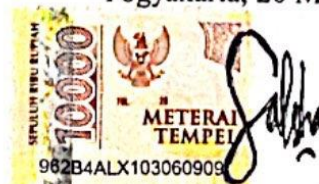
Dinda Salshabila Fortuna