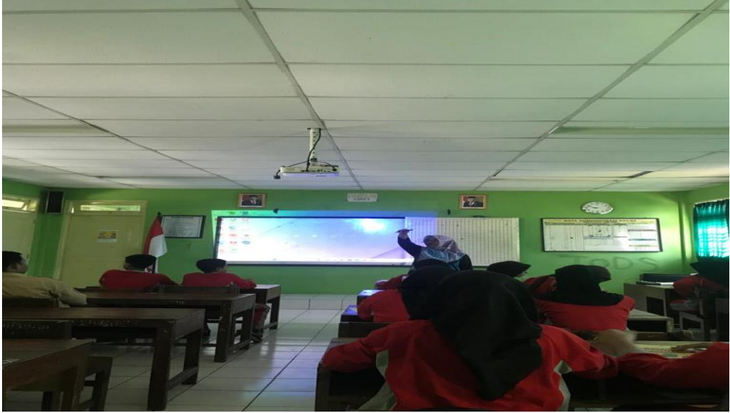
Observation 8 B