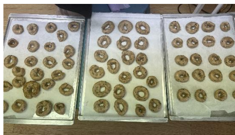
Gambar 2. Hasil cookies pada kegiatan baking competition

Pada kegiatan baking competition, anak-anak menimbang dan melakukan langkah pembuatan cookies sesuai instruksi. Setelah dilakukan penilaian, hasil dari cookies yang mereka buat akan dimakan bersama.