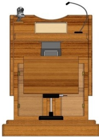
Gambar 4 - Tampak Belakang