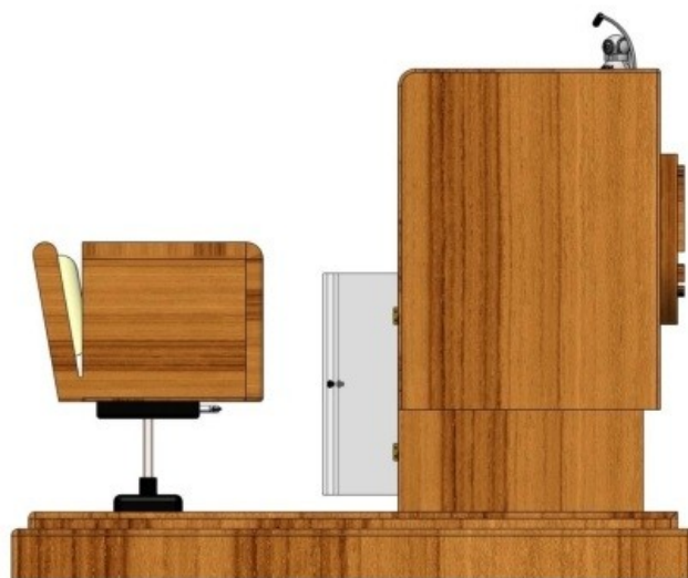
Gambar 5 - Tampak Samping Kiri