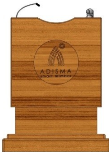
Gambar 3 - Tampak Depan