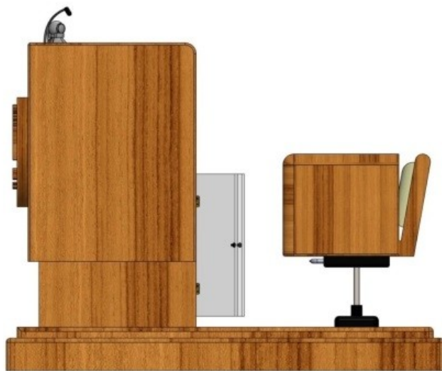
Gambar 6 - Tampak Samping Kanan