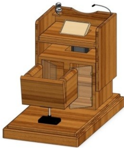
Gambar 1 - Tampak Perspektif