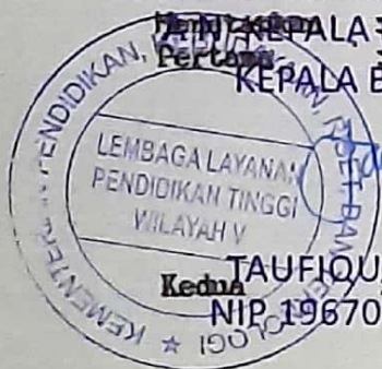
FOTO COPY SESUAI DENGAN ASLINYA YOGYAKARTA .....

Memperhatikan pula : 1. Surat Edaran Kepala BAKN No.12/SE/1975 tgl.14-10-1975; MENCEKAT UNDIDKUD : No. 25945/A2.IV.1/C/91 tgl. 6 Mei 1991.