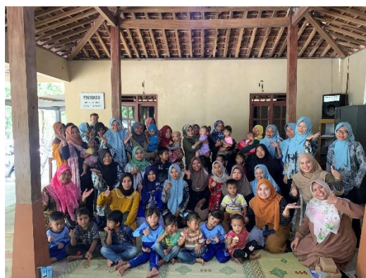
Gambar 2. Dokumentasi Kegiatan Pengabdian kepada Masyarakat