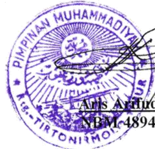
Amis Arifudin NEM 489448