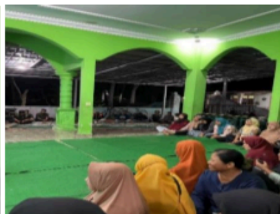
Gambar 2. Masyarakat menyimak pemaparan mengenai literasi keuangan syariah