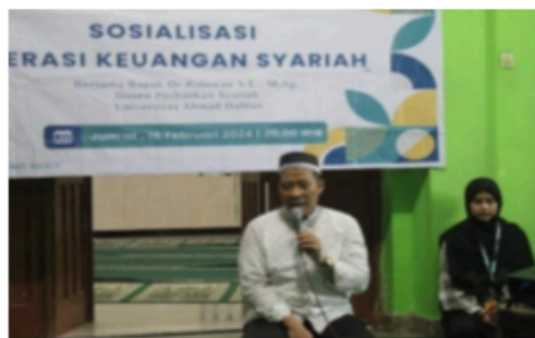
Gambar 1. Pemaparan materi mengenai literasi keuangan syariah