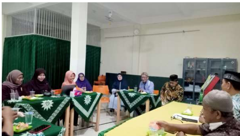
Gambar 1. Rapat dengan mitra untuk persiapan program PESILAT, 31 Januari 2024

Mitra dalam program pengabdian masyarakat ini adalah Majelis Pembinaan Kesejahteraan Sosisl (MPKS) Pimpinan Daerah Muhammadiyah Kota Yogyakarta (PDM Kota Yogyakarta), Pimpinan Cabang Muhammadiyah Mantri Jeron dan Rumah Sakit PKU Muhammadiyah Gamping. Pelaksana berkoordinasi dengan mitra dan selanjutnya mitra persiapan pemeriksaan kesehatan gratis untuk lansia dan menyiapkan peserta pelatihan. Sebelum pelaksanaan pengabdian, pelaksana dan mitra melakukan pertemuan dalam rangka persiapan kegiatan PESILAT yang dilaksanakan pada 10 Januari 2024 yaitu membentuk Tim bersama antara panitia UAD dan Mitra yaitu PDM Kota Yogyakarta dan Pimpinan Cabang Muhammadiyah yang dilanjutkan dengan membuat grup whatsapp untuk koordinasi kegiatan. Tim UAD menyiapkan materi dan media pembelajaran program pesilat. Kemudian pada hari Kamis, 31 Januari 2024 jam 18.30 s.d selesai, bertempat di Masjid Al Huda Mangkuyudan Kota Yogyakarta dilakukan persiapan kegiatan program pesilat dilokasi kegiatan.