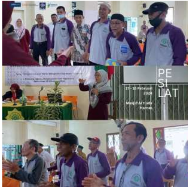
Gambar 2. Kegiatan PkM Program Pesilat 2024

deteksi dini kesehatan mental lansia dengan isu kesehatan reproduksi pada lansia, isu kesehatan reproduksi pada lansia, pencegahan dan pengendalian faktor penentu Penyakit Tidak Menular (PTM) pada lansia, dan materi kajian fikih Husnul Khotimah.