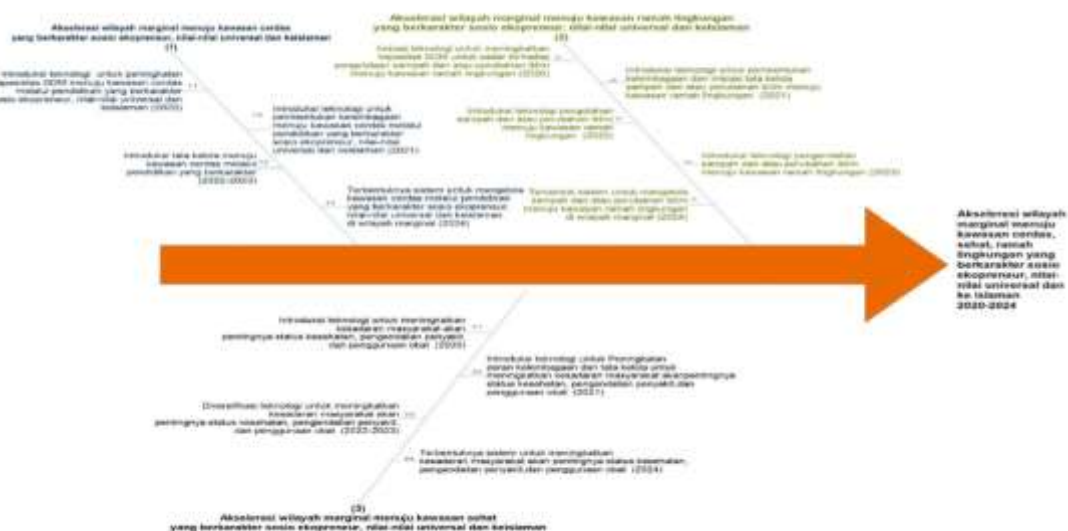
Gambar 1. Roadmap Pengabdian Fakultas Kesehatan Masyarakat Tahun 2021-2025

Berdasarkan analisis situasi dan permasalahan yang dialami mitra, maka perlu dilakukan pengabdian kepada masyarakat dengan sasaran adalah lansia di wilayah PCM/PCA Kota Yogyakarta. Kegiatan pengabdian tersebut berupa pembinaan lansia, pemberian edukasi kesehatan dan perawatan kesehatan lansia secara holistic dan inisiasi pembentukan kader lansia di setiap cabang Muhammadiyah dan 'Aisyiyah. Kegiatan ini sesuai dengan road map dan Rencana Strategis Pengabdian kepada Masyarakat Fakultas Kesehatan Masyarakat seperti pada gambar 1 dan gambar 2 berikut ini.