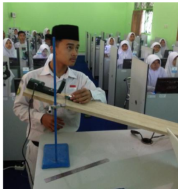
Gambar 3. Kegiatan saat pembelajaran

Proses pembelajaran meliputi eksperimen sederhana yang dilakukan guru dan dibantu siswa. Angket proses pembelajaran diberikan pada siswa sebelum proses pembelajaran berlangsung. Secara keseluruhan proses pembelajaran berjalan baik dan kondusif meskipun masih dipenuhi beberapa hambatan yang ditemukan. Dalam uji coba ini menggunakan angket yang terdiri dari dua jenis yaitu angket validasi panduan dan angket proses pembelajaran menggunakan model Discovery Learning .