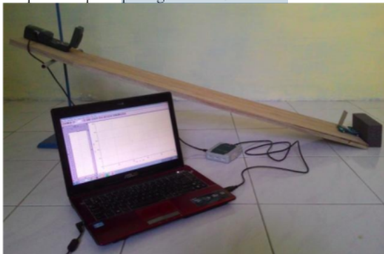
Gambar 1. Susunan apparatus eksperimen

sampul panduan dan proses kegiatan berturut-turut dapat ditampilkan seperti pada gambar 1, 2 dan 3.