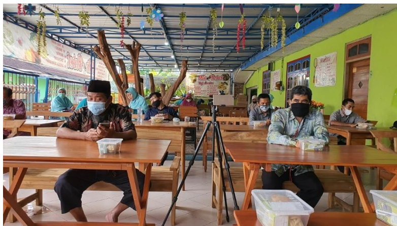
Gambar 1. Peserta pelatihan menyimak penjelasan dan demo praktek pembuatan sabun

Pelatihan pengolahan minyak jelantah ini secara umum berjalan sesuai rencana, target materi berupa penjernihan minyak jelantah, pembuatan sabun dan lilin dari minyak jelantah yang sudah disaring dapat diberikan kepada mitra. Masalah yang dihadapi adalah kondisi pandemi yang tidak memungkinkan tim pengabdian berinteraksi secara luring dalam waktu yang lama dan jumlah yang banyak. Pada pelatihan ini peserta dibatasi 25 orang dengan memperhatikan kondisi tempat, jarak antar peserta, dan waktu kegiatan yang terbatas. Dibandingkan dengan pengabdian sebelumnya pada kondisi normal maka pengabdian pada masa pandemi ini terasa kurang efektif karena penjelasan dengan daring, sedangkan peserta banyak yang belum terbiasa dengan cara ini. Demikian juga dengan keterbatasan waktu juga membatasi kesempatan peserta untuk mencoba praktek pembuatan sabun dan lilin. Terlihat sebagian peserta terlihat dalam Gambar 1.