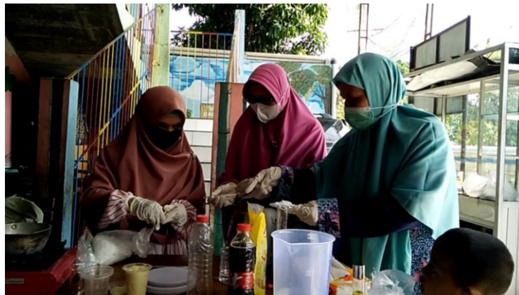
Gambar 3. Perwakilan peserta praktek membuat sabun

Hasil dari pelatihan ini peserta mendapatkan pengetahuan cara menjernihkan dan menghilangkan bau minyak jelantah sehingga dapat diolah menjadi produk berupa sabun dan lilin. Proses penjernihan dan penghilangan bau ini sangat penting apabila minyak jelantah digunakan sebagai bahan baku membuat sabun dan lilin, sehingga akan diperoleh sabun dan lilin dengan warna yang lebih menarik karena dasar minyak jelantah menjadi lebih pucat dan aroma bisa diberikan sesuai selera dengan memberikan pewangi tanpa ada campuran aroma makanan yang diolah. Perbandingan warna minyak jelantah hasil penjernihan dapat dilihat pada Gambar 4, dengan urutan dari kiri ke kanan adalah minyak hasil penjernihan 2 x 24 jam, minyak dengan penjernihan 2 jam dan minyak jelantah belum diolah yang terlihat paling gelap.