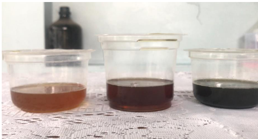
Gambar 4. Minyak jelantah yang dijernihkan dari kiri ke kanan hasil penjernihan 2 x 24 jam, 2 jam dan minyak jelantah belum dijernihkan.

Hasil dari pelatihan ini peserta mendapatkan pengetahuan cara menjernihkan dan menghilangkan bau minyak jelantah sehingga dapat diolah menjadi produk berupa sabun dan lilin. Proses penjernihan dan penghilangan bau ini sangat penting apabila minyak jelantah digunakan sebagai bahan baku membuat sabun dan lilin, sehingga akan diperoleh sabun dan lilin dengan warna yang lebih menarik karena dasar minyak jelantah menjadi lebih pucat dan aroma bisa diberikan sesuai selera dengan memberikan pewangi tanpa ada campuran aroma makanan yang diolah. Perbandingan warna minyak jelantah hasil penjernihan dapat dilihat pada Gambar 4, dengan urutan dari kiri ke kanan adalah minyak hasil penjernihan 2 x 24 jam, minyak dengan penjernihan 2 jam dan minyak jelantah belum diolah yang terlihat paling gelap.