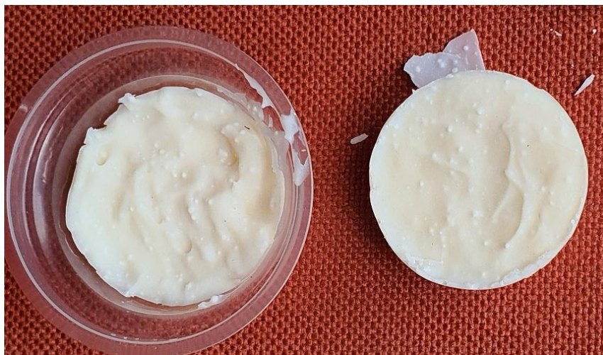
Gambar 5. Sabun padat hasil praktek peserta pelatihan

Pelatihan penjernihan minyak jelantah, pembuatan sabun walaupun diselenggarakan secara terbatas karena pandemi tetapi sudah bisa memberikan pengalaman peserta untuk menjernihkan dan membuat sabun. Pengalaman pertama bagi peserta tentu saja belum dapat menghasilkan produk yang berkualitas, dengan pengalaman ini diharapkan peserta dapat meningkatkan ketrampilan dalam hal penjernihan minyak jelantah serta pembuatan sabun dan lilin dari minyak jelantah. Ketrampilan perlu diasah terus dan ditambah dengan kreatifitas dan apabila dilakukan secara komunal maka dapat meningkatkan kualitas produk dan nilai keekonomian. Pendampingan untuk membuat sabun yang layak dikomersialkan sangat penting untuk mendapatkan pendapatan tambahan dari pengolahan minyak jelantah ini.