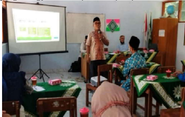
Gambar 1. Materi tentang Penguatan SDM Dari Perspektif PAI Menghadapi Masa Pandemi Covid-19

masyarakat (PKM) ini dibuka oleh pimpinan ranting Muhammadiyah Samigaluh Kabupaten Kulonprogo Yogyakarta, seperti tampak pada Gambar 1, 2, dan 3.