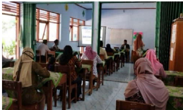
Gambar 2. Materi tentang Penguatan SDM Dari Perspektif Psikologis Menghadapi Masa Pandemi Covid-19