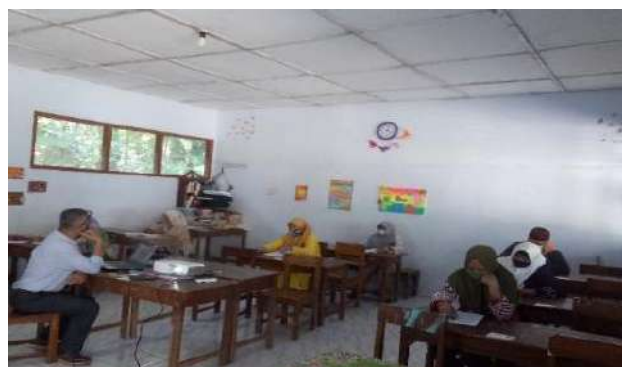
Gambar 3. Materi tentang Penguatan SDM Dari Perspektif Ekonomi Menghadapi Masa Pandemi Covid-19