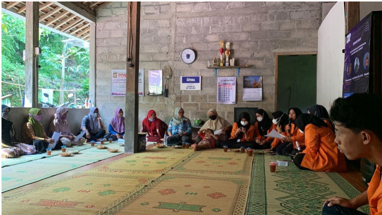
Gambar 4.1 Foto peserta dan panitia pelaksana

Pelatihan dan pendampingan dilakukan pada hari Jumat, 14 Agustus 2024 di ruang pertemuan padukuhan Dengok. Pelaksanaan pelatihan digital marketing memberikan materi menjelaskan bagaimana strategi dan langkah untuk memasarkan produk melalui digital marketing. Peserta yang hadir sebanyak 27 orang yang mewakili kedua dukuh. Foto bersama peserta pelatihan dan panitia pelaksana pelatihan internet desa melalui digital marketing bagi UMKM dapat dilihat pada Gambar berikut 4.1.