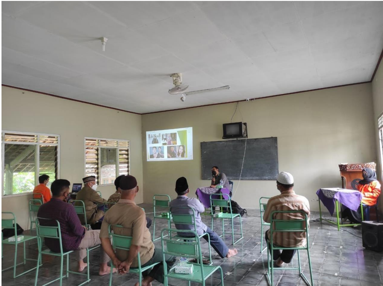
Gambar 4.2. Pelatihan digital marketing

market place, sampai pada cara melakukan transaksi jual beli. Dokumentasi saat pelatihan digital marketing pada gambar 4.2.