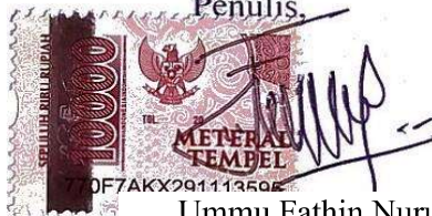
Ummu Fathin Nurul Faridah