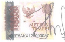
Dian Wahyu Ningrum