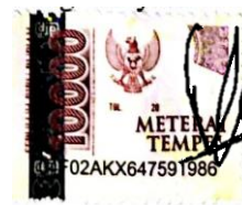
Viona Ayuning Tyas