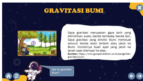
Gambar 9. Tampilan Materi Gravitasi Bumi

Gambar 9 memaparkan materi gravitasi bumi yang merupakan fenomena alam. Dijelaskan pada halaman tersebut pengertian gravitasi bumi, serta dijelaskan juga cara atau prosedur untuk membuktikan gaya gravitasi bumi tersebut dengan mengamati buah apel yang jatuh. Melalui penjelasan ini diharapkan peserta didik mampu mengetahui landasan mengapa digunakan prosedur pengamatan buah apel karena seluruh benda yang berada di atas akan jatuh ke permukaan bumi karena adanya gaya tarik bumi.