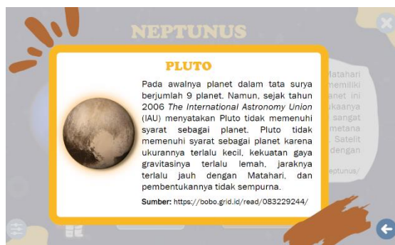
Gambar 7. Tampilan Materi Pluto

Gambar 6 merupakan tampilan materi orbit planet yang ada pada multimedia tata surya berbasis Articulate Storyline yang dikembangkan. Pada halaman tersebut dijelaskan terlebih dahulu deskripsi orbit planet yang dilanjutkan dengan penjelasan peristiwa yang terjadi ketika orbit planet tidak ada. Penjelasan mengenai peristiwa tidak adanya orbit planet ini yang mewakili permasalahan yang terjadi. Sehingga ketika peserta didik mempelajari materi orbit planet ini, maka mereka mampu untuk mengetahui ketika terdapat permasalahan sains yang terjadi terutama pada materi tata surya.