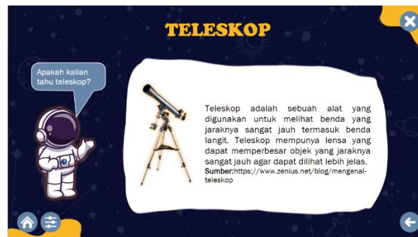
Gambar 12. Tampilan Materi Teleskop

Gambar 11 menunjukkan tampilan materi planet Mars yang ada dalam multimedia tata surya berbasis Articulate Storyline . Salah satu deskripsi pada halaman tersebut mengatakan bahwa julukan planet Mars adalah planet merah. Hal ini dibuktikan dengan melihat planet tersebut menggunakan teleskop planet tersebut berwarna merah sehingga pada halaman selanjutnya dipaparkan kegunaan dari teleskop yang dapat dilihat pada Gambar 12. Sehingga tanpa sadar peserta didik akan teredukasi untuk merancang atau mengonstruksi penyelidikan planet merah menggunakan teleskop.