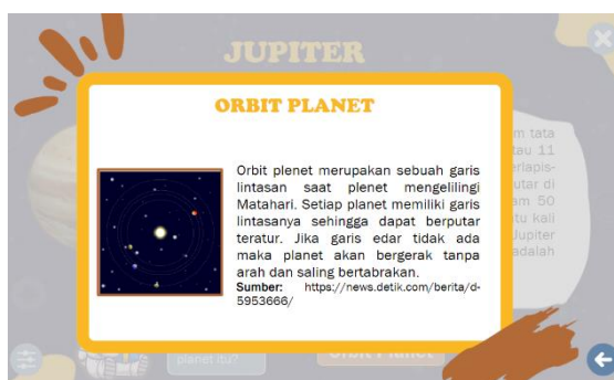
Gambar 6. Tampilan Materi Orbit Planet

Selain kelebihan yang sudah dipaparkan sebelumnya kelebihan lain dari multimedia tata surya berbasis Articulate Storyline adalah terintegrasi dengan setiap aspek literasi sains kecuali aspek sikap karena keterbatasan waktu dan biaya dalam pengukurannya. Aspek konteks berkaitan dengan wawasan peserta didik dalam memandang keadaan yang ada pada kehidupan nyata dalam bentuk sebuah permasalahan baik lingkup personal, daerah, negara, maupun dunia, dan permasalahan yang masih hangat maupun permasalahan lawas yang berkaitan dengan sains dan teknologi (Firmayanto et al., 2020: 29). Penjelasan tersebut memaparkan bahwa aspek konteks sains ini menuntut peserta didik untuk mampu memahami permasalahan sains yang ada dalam kehidupan dan memahami akan isu-isu sains dalam kehidupan nyata.