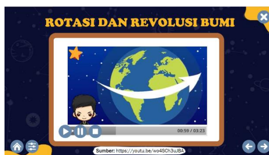
Gambar 5. Tampilan Video Rotasi dan Revolusi Bumi

Video pembelajaran beragam yang ditampilkan dalam multimedia tata surya berbasis Articulate Storyline menjadi kelebihan selanjutnya. Video yang berkaitan dengan materi tata surya digunakan sebagai pelengkap dari contoh gambar agar peserta didik lebih paham terhadap materi pembelajaran. Pengadaan video juga ditujukan agar materi yang sulit dijelaskan dalam bentuk teks atau kata-kata dapat diilustrasikan menggunakan video agar lebih jelas. Tampilan video dapat dilihat pada gambar 5.