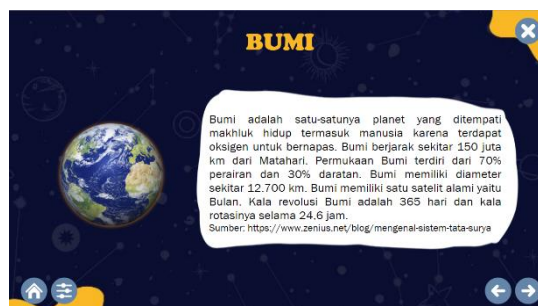
Gambar 3. Tampilan Materi Bumi

Gambar 2 menampilkan salah satu halaman materi tata surya yaitu lapisan bumi. Materi ditampilkan dalam bentuk gambar menarik yang dapat ditekan setiap lapisannya kemudian akan memunculkan setiap materi lapisan bumi. Selain itu terdapat juga karakter Astronaut yang membimbing peserta didik untuk mengoperasikannya. Hal ini akan menarik perhatian peserta didik sehingga tidak bosan selama mempelajari materi tata surya.