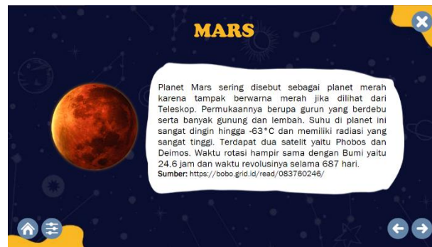
Gambar 11. Tampilan Materi Planet Mars