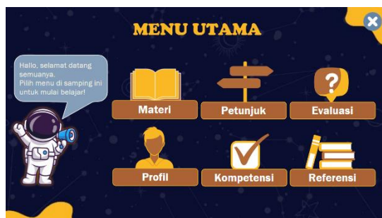
Gambar 1. Tampilan Halaman Utama

sekolah yang sekaligus menjadi keunggulan dari multimedia tata surya berbasis Articulate Storyline yang dikembangkan.