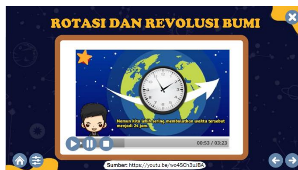
Gambar 13. Tampilan Video Rotasi dan Revolusi Bumi

Gambar 11 menunjukkan tampilan materi planet Mars yang ada dalam multimedia tata surya berbasis Articulate Storyline . Salah satu deskripsi pada halaman tersebut mengatakan bahwa julukan planet Mars adalah planet merah. Hal ini dibuktikan dengan melihat planet tersebut menggunakan teleskop planet tersebut berwarna merah sehingga pada halaman selanjutnya dipaparkan kegunaan dari teleskop yang dapat dilihat pada Gambar 12. Sehingga tanpa sadar peserta didik akan teredukasi untuk merancang atau mengonstruksi penyelidikan planet merah menggunakan teleskop.