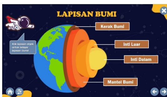
Gambar 2. Tampilan Materi Lapisan Bumi

Gambar 1 menunjukkan tampilan halaman utama terdiri dari beberapa menu mulai dari menu materi, petunjuk, evaluasi, profil, kompetensi, dan referensi. Peserta didik dapat memilih secara bebas ingin menampilkan menu yang mereka pilih. Peserta didik akan menekan setiap menu yang mereka pilih serta mengoperasikan tombol navigasi yang telah disediakan untuk menjalankan multimedia tata surya berbasis Articulate Storyline ini. Kegiatan yang dilakukan ini akan pastinya sangat melibatkan peserta didik dalam proses pembelajaran sehingga peserta didik tidak akan bosan dalam pembelajaran.