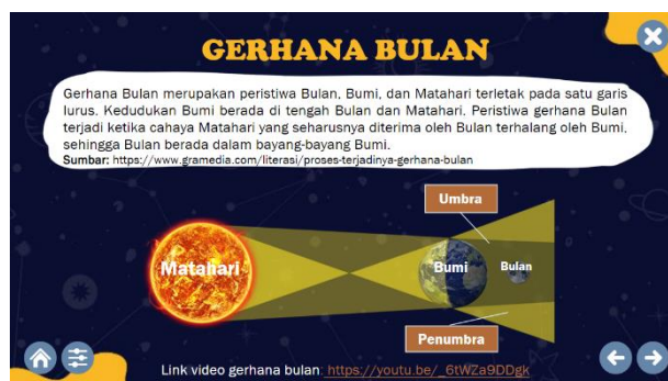
Gambar 10. Tampilan Materi Gerhana Bulan

Aspek kompetensi sains berisi kecakapan dalam memaparkan sebuah peristiwa dengan faktual, menilai dan merancang investigasi faktual, dan mengolah sebuah informasi nyata secara faktual (Nurwidiyanti & Sari, 2022:6956). Dari pernyataan tersebut dapat dipahami bahwa pada aspek kompetensi sains ini seseorang diajak untuk mampu menjelaskan fenomena ilmiah, merancang penyelidikan ilmiah, dan membuktikan secara ilmiah.