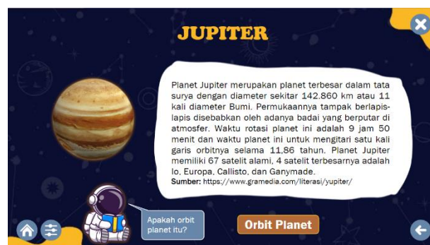
Gambar 8. Tampilan Materi Planet Jupiter

Aspek pengetahuan sains terbagi menjadi pengetahuan konten, pengetahuan prosedural, dan pengetahuan epistemik. Pengetahuan konten adalah pengetahuan yang berkaitan dengan konten sains yang meliputi fisika, kimia, biologi, dan ilmu lain yang mempelajari alam dan luar angkasa yang berkaitan dengan fakta di lapangan. Jadi, pengetahuan konten terkait pemahaman seseorang dalam memahami konsep sains yang ada dalam kehidupan nyata.