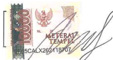
Aulia Dwindi Putri