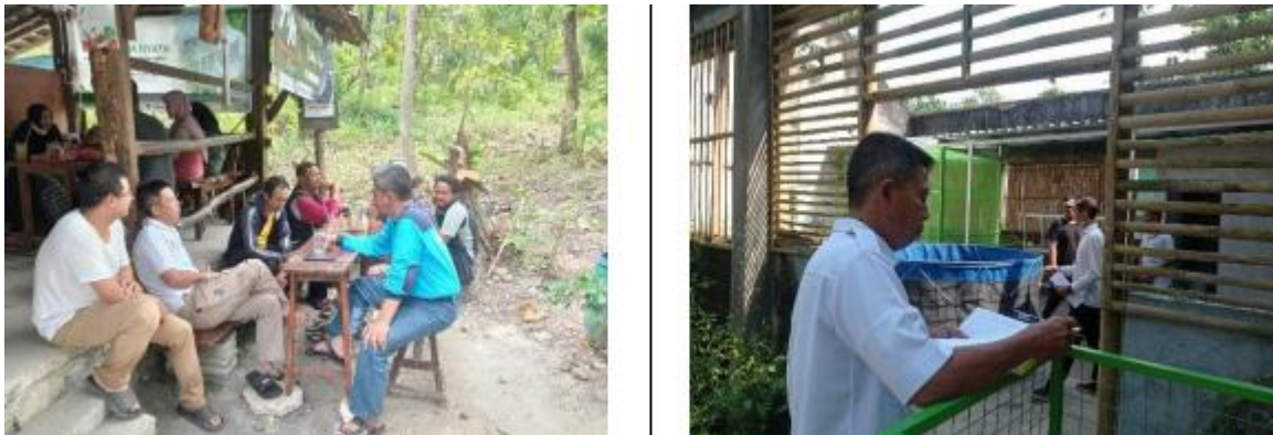
Gambar 1. Pelaksanaan Koordinasi dan Persiapan Lokasi

Kegiatan ini diawali dengan koordinasi bersama dengan perangkat yang ada di Kelurahan Caturharjo yang dihadiri oleh DLH Bantul, Kelurahan Caturharjo, Bumkal Catur Sejahtera dan Dukuh Kuroboyo. Adapun pelaksanaan kegiatan dapat dilihat pada gambar 1.