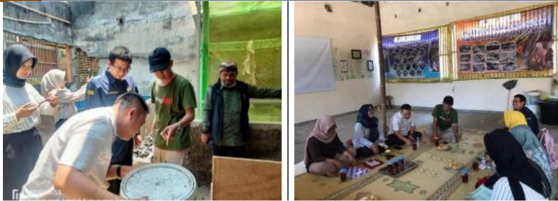
Gambar 2. Pelatihan dan Diskusi terkait Pengelolaan Maggot