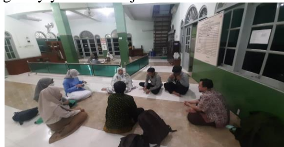
Pertemuan 1. Pengantar Literasi Keuangan dan UMKM Go Digital Gambar 2.