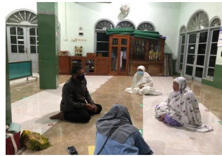
Diskusi Awal Tentang Potensi UMKM dan BUEKA Ranting Wirobrajan bersama dengan Pimpinan Ranting Aisyiyah Wirobrajan