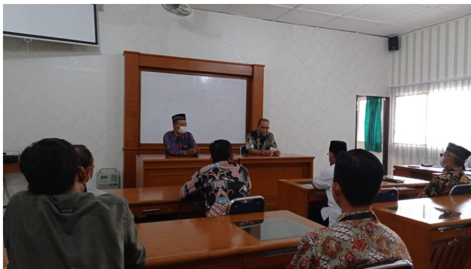
Gambar. 1. Koordinasi Tim. PPM se Program Studi Manajemen Dihadiri oleh LPCR PP. Muhammadiyah

Kegiatan ini diawali dengan kegiatan diskusi bersama antara Tim PPM dan pimpinan cabang Muhammadiyah Wirobrajan di Laboratorium Manajemen Fakultas Ekonomi dan Bisnis Universitas Ahmad Dahlan. Bersama dengan TIM PPM lain di Lingkungan Program Studi Manajemen.