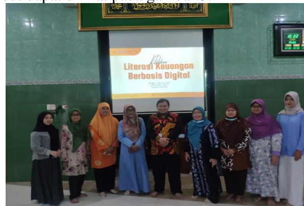
Gambar 3. Pelatihan Pencatatan Keuangan Digital