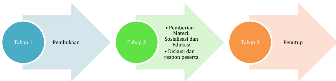
Gambar 1. Tahapan Kegiatan Sosialisasi dan Edukasi

Metode pelaksanaan pengabdian meliputi sosialisasi, diskusi dan praktik. Kegiatan pertama yaitu memberikan pelatihan dan pendampingan keuangan/penentuan Harga Pokok produksi dilakukan pada 28 Agustus 2022. Adapun tahapan pelaksanaan seperti tersaji pada Gambar 1. Dimulai dengan tahap 1 yaitu pembukaan, dilanjutkan pemberian materi sosialisasi dan edukasi, diskusi dan respon peserta pada tahap 2, dan diakhiri dengan penutup pada tahap 3.