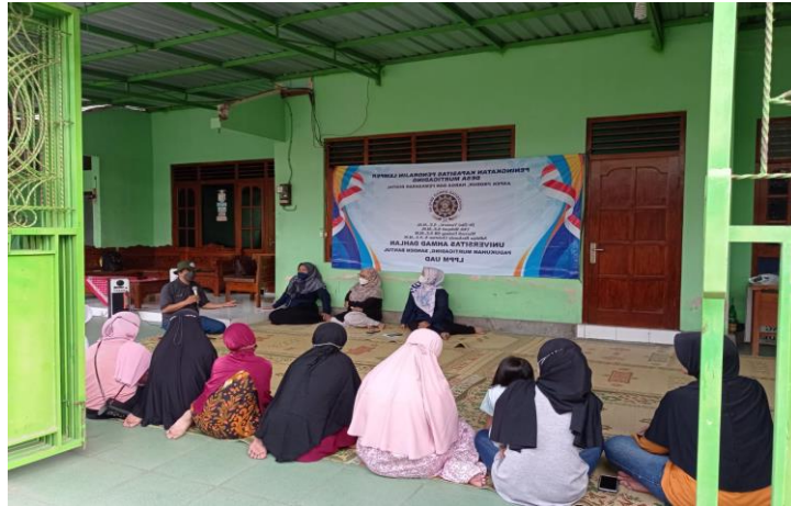
Gambar 3. Kegiatan Pelatihan Penghitungan HPP

Pendampingan penentuan harga pokok produksi dilakukan pada tanggal 28 Agustus 2022. Peserta kegiatan terdiri dari perajin lemper di Desa Murtigading, Kecamatan Sanden, Kabupaten Bantul. Sosialisasi, pelatihan dan diskusi dilakukan secara luring. Gambar 3 menyajikan pelaksanaan kegiatan.