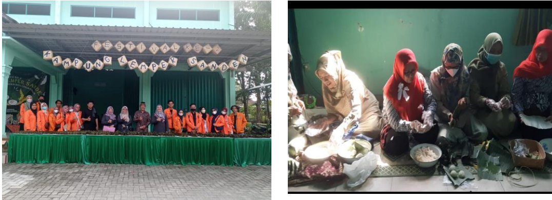
Gambar 4 Festival Lemper Sanden

untuk melakukan pengecekan apakah peserta telah memahami materi. Peserta festival terdiri dari 17 perajin. Hasil dari praktik penghitungan menunjukkan, bahwa dari 17 peserta sebanyak 15 peserta telah mampu menghitung harga pokok produksinya. Hal ini menunjukkan adanya peningkatan pengetahuan dan keterampilan perajin. Gambar 4 menyajikan kegiatan Festival.