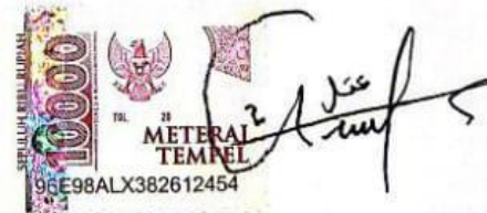
Dhiya'atul Izzati Tokan