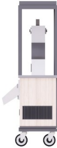
Gambar 3 : Tampak Samping Kanan