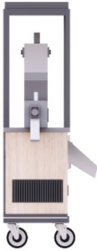
Gambar 4 : Tampak Samping Kiri