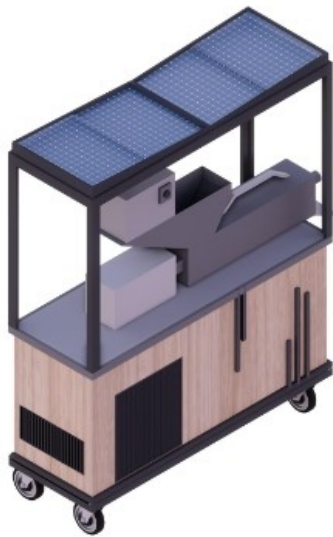
Gambar 2 : Tampak Belakang