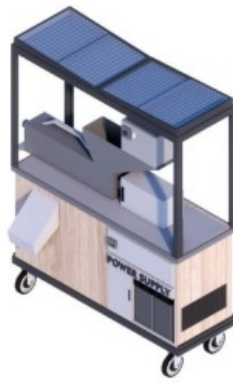
Gambar 6 : Perspektif