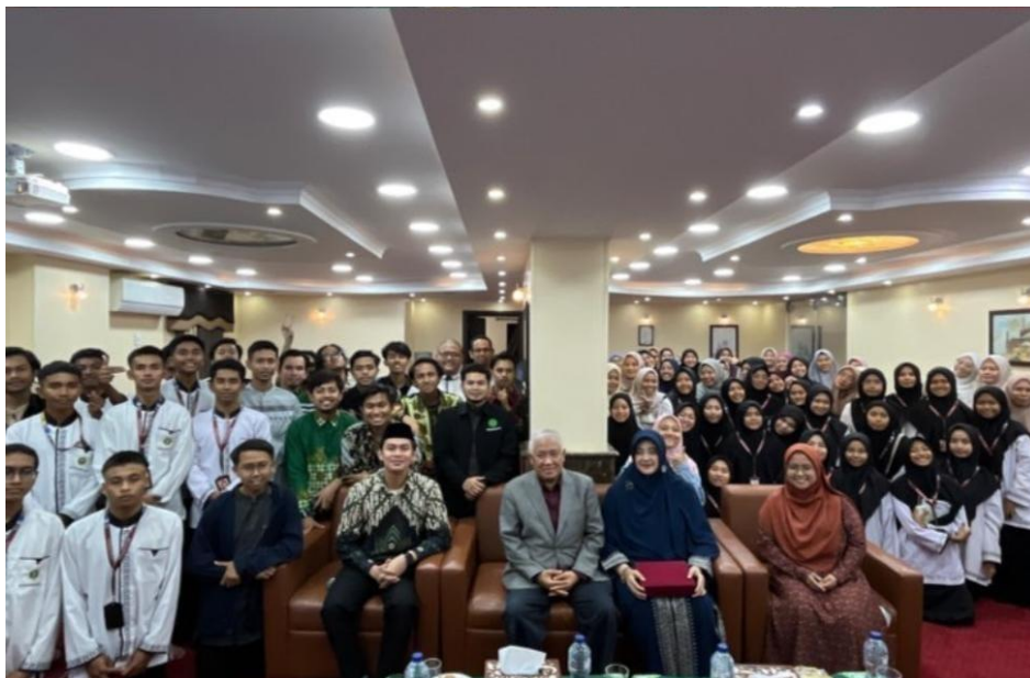
Keluarga besar PCIM Mesir pada sebuah kegiatan

Termasuk dalam hal ini, upaya mengenalkan bahasa dan budaya Indonesia bagi masyarakat asing di Mesir menjadi salah satu hal yang menjadi perhatian pemerintah akhir-akhir ini, hal ini dikarenakan jumlah warga negara Indonesia yang menetap di Mesir cukup tinggi. Perlu adanya kedekatan dan toleransi bahasa serta budaya antara warga Mesir dan warga negara Indonesia yang menetap di Mesir.