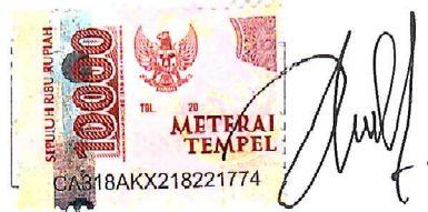
Nurul Putri Islami

Yogyakarta, 23 September 2022 Yang Menyatakan