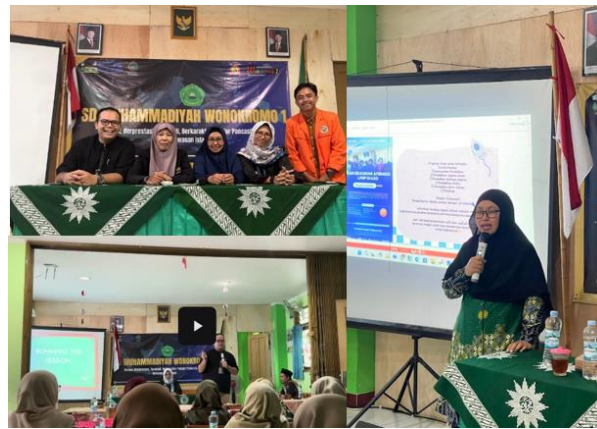
Gambar 2. Tim pengabdian dan pelatihan classroom language

Dosen berperan pada bagian penyampaian materi sedangkan mahasiswa terlibat pada bagian teknis persiapan maupun pelaksanaan dan juga dokumentasi acara pelatihan (Gambar 2).