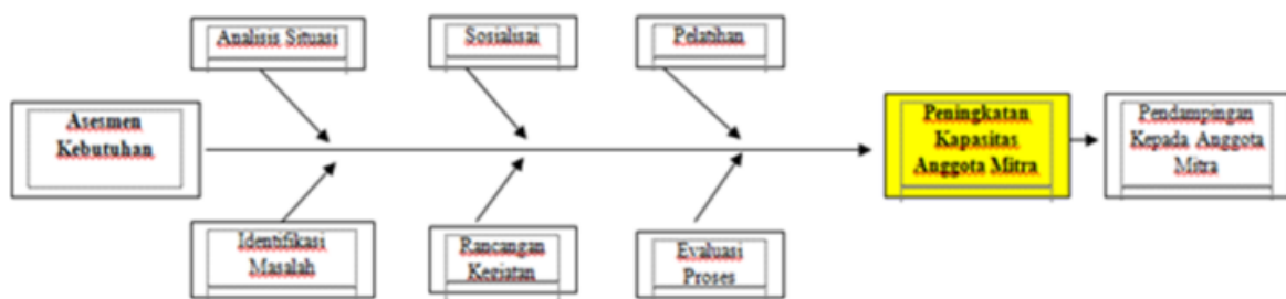
Gambar 3. Alur pelaksanaan kegiatan pengabdian pada masyarakat

Secara skematik ketiga tahapan dalam pelatihan tersebut dapat diilustrasikan melalui Gambar 3 berikut.